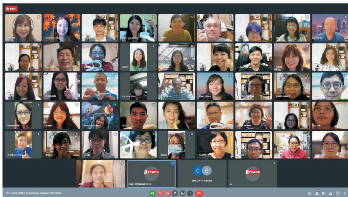
雙語教育培訓研習人員線上課程大合照

除此之外，在機制平台方面，本校雙語教學研究中心與區域夥伴整合專業發展之架構，引入雙語教學師資培用聯盟，形成特色教學。以雙語教學為核心，扣連教材、教學法、課程結構及培訓等環節，符應十二年國民教育「多元教學、適性揚才、差異教學、補救教學」之重點方針。民國110年期間本計畫制定了一系列領域教材及教案，約30人次參與，當中涵蓋科技領域英語授課教師教學用語手冊、綜合活動領域英語授課教師教學用語手冊、科技領域雙語教學授課教案、綜合活動領域雙語教學授課教案、數學領域雙語教學授課教案、藝術領域雙語教學授課教案、自然科學領域雙語教學授課教案及雙語專有名詞手冊、全英語教學授課教案、課室英語用語 (Classroom English)、各領域專業術語表及各領域雙語教學授課影片。所有教材作為未來教學上的參考資料，完成後進行相關教師研習坊及分享平台計畫網站。(本文作者為英語系教授及雙語教學計畫研究員)