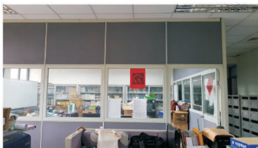
圖二：通識教育中心整修前之會議室