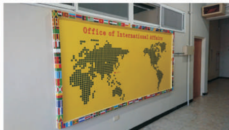
國際處辦公室裝修完工後實景