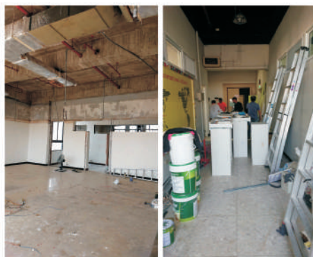
國際處辦公室裝修工程過程

因應全球化浪潮、臺灣少子化現況，建構國際化校園並促進國際交流乃高等教育邁向卓越之重要課題，在吳連賞校長重視與支持下，105學年度成立的一級單位國際處係由原來的研究發展處國際合作組二級單位修編而來，期許在組織架構的提升、人員擴增及全校各單位推動國際化之共識下，使國際化業務更上一層樓，提升本校聲譽及國際競爭力。（本文作者為國際處編審）