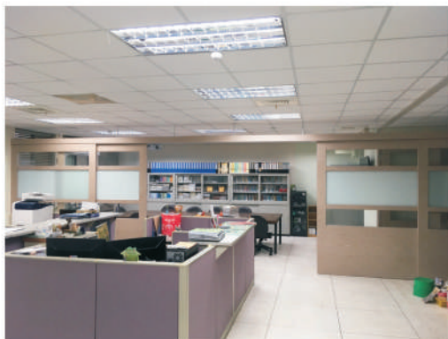
圖三：通識教育中心整修後之空間