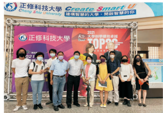
藝術文物修復之旅參訪活動照片

黃明川導演從百位詩人計畫，啟發了對於女詩人缺席的感觸，收錄印度、斯里蘭卡、菲律賓及臺灣撒奇萊雅族等16位女詩人的影像聲音。以女詩人、受殖民的主體，文字的抵抗與自由為主題，除展示出一種向亞洲出發的決心外，並帶出更多女性心中的感動，發人深省！（本文作者為藝術學院祕書）