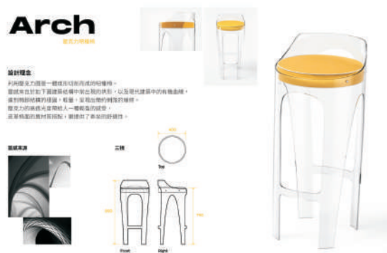
賴景德—Arch 壓克力吧檯椅