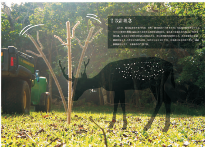
2022金點新秀設計獎 新一代產學合作銅獎作品介紹 蒲郁淇－好所在

在全球設計抬頭的年代，臺灣的設計逐漸在國際上嶄露頭角；設計科系學生的無限創意潛力更是令人期待，本校工業設計學系第二屆畢業成果展從111年5月起開始一連串的展覽活動，展現南臺灣火熱的創意活力！