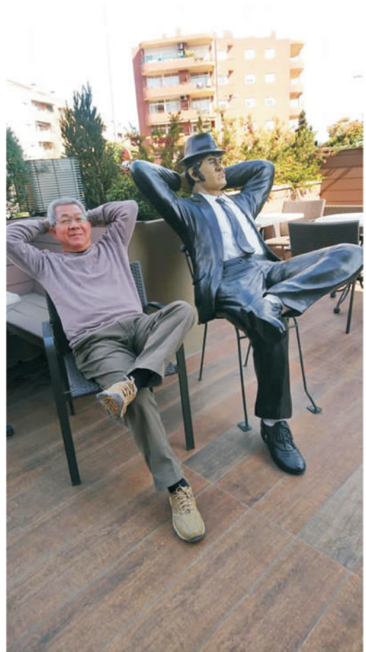
康義勇教授