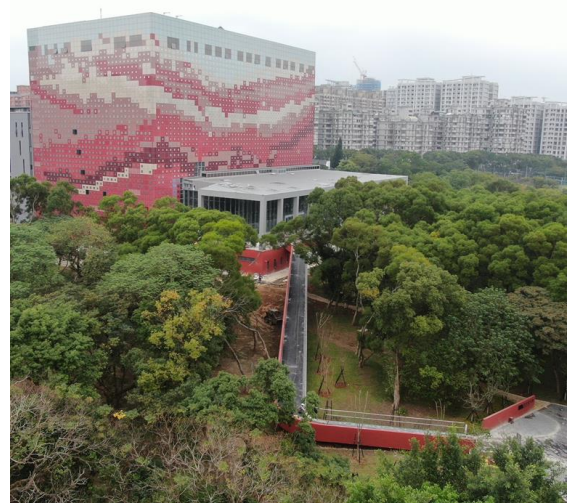
國家檔案館外觀實景圖 2