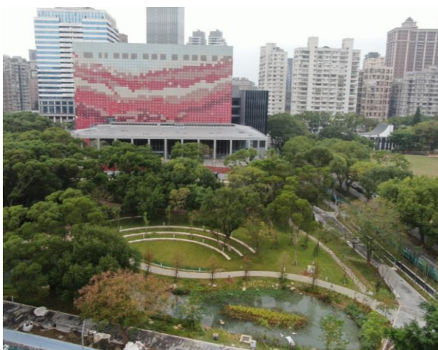
國家檔案館外觀實景圖 1