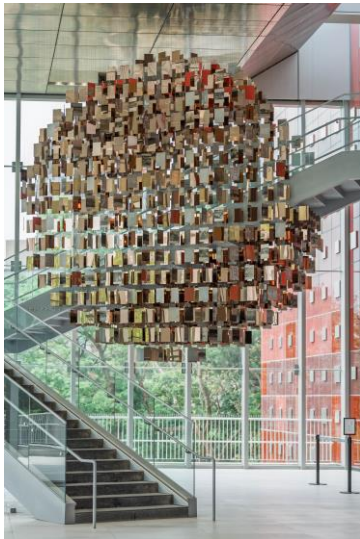
國家檔案館「以史為鏡」公共藝術照

請至檔案局全球資訊網/認識我們/局館簡介/本館簡介/場域介紹，查看相關資訊。( https://www.archives.gov.tw/tw/arctw/699.html )