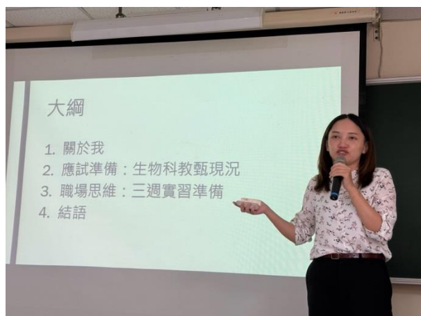
講師說明講座大綱