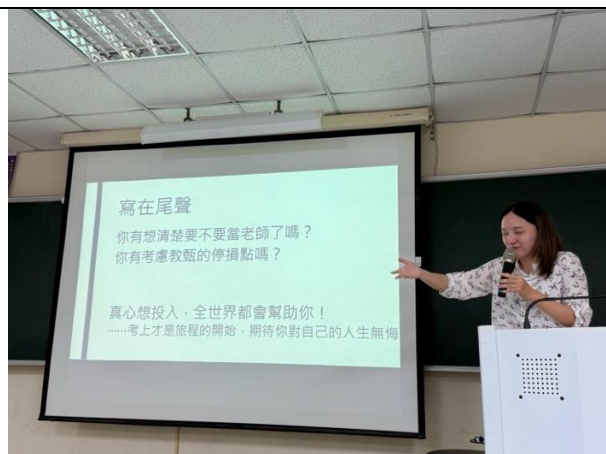
講師說明職場上現況