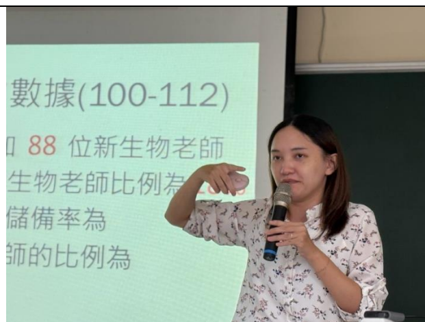
講師說明職場上生物老師錄取狀況